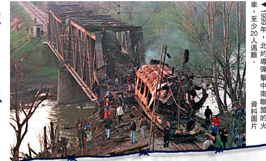
▲1999年，北約導彈擊中南聯盟的橋樑，至少20人遇難。資料圖片

普京4月26日會見古特雷斯時表示，莫斯科承認頓巴斯地區「頓涅茨克共和國」和「盧甘斯克共和國」獨立，是基於聯合國在科索沃問題上開創的先例。古特雷斯回應說，聯合國本身並未承認科索沃是一個獨立實體，仍將其視為塞爾維亞的一部分。但普京直言，科索沃得到了西方國家的廣泛認可，「我們對頓巴斯地區的兩個共和國也做了同樣的事情。」 科索沃是原南聯盟塞爾維亞共和國的自治省，1999年6月科索沃戰爭後由聯合國託管。2008年2月17日，科索沃宣布脫離塞爾維亞，美國等西方國家隨即承認其獨立地位。2010年7月，聯合國國際法院宣布科索沃的決定「不違反國際法」。該裁決雖無法律約束力，但無疑如普京所言開創了「先例」。 塞爾維亞總統武契奇批評西方國家在科索沃和烏克蘭問題上採取雙重標準。塞爾維亞社會黨副主席馬爾科維奇指出，西方國家如今為烏克蘭的婦女兒童流淚，但它們1999年轟炸塞爾維亞時卻是另一副嘴臉。科索沃戰爭期間，北約打着「維護人權」的幌子，在未經聯合國安理會批准的情況下持續轟炸南聯盟78天，迫使其撤軍。空襲導致約2500名平民死亡，100萬人淪為難民，經濟損失難以估算。 時任南聯盟空軍總司令斯密利安里奇指出，北約支持科索沃是為了控制巴爾幹半島這一戰略要地。此舉亦令俄羅斯感到威脅。空襲結束後，時任俄安全委員會主席的普京安排200名空降兵直撲科索沃首府，搶在北約軍隊抵達前佔領普里什蒂納國際機場。雙方在機場對峙，最終北約同意俄方在科索沃部署獨立的維和部隊。