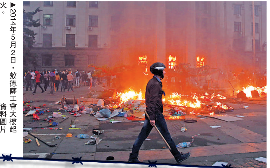
▲2014年5月2日，敖德薩工會大樓起火。資料圖片

在同樣有大量俄羅斯族人口的敖德薩，親歐派極端分子於2014年5月2日製作了「敖德薩慘案」。當天，親歐派將親俄派人士逼進工會大樓，並向樓內投擲燃燒彈和自製汽油彈，引發大火，導致近50人死亡。俄媒指，現場的警察並未及時干預，兇手至今逍遙法外。 俄媒稱，「敖德薩慘案」是一個轉折點，令俄羅斯及親俄人士堅定了戰鬥到底的決心。